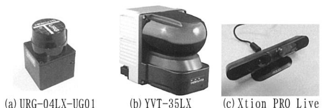
図 2：貸出予定の 2 次元・3 次元距離センサ